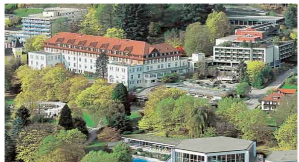
Landesakademie für Lehrerfortbildung

Das Hochschulbüro erreichen Sie durch das Gebäude der Landesakademie, dazu folgen Sie der Ausschilderung im Gebäude. Bitte melden Sie sich am Empfang der Akademie an.